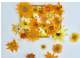
Restitution partenariat lycée Saint-Sernin

Loïc Ambert, médiateur sourd, vous propose une visite en langue des signes de l'exposition.