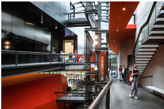
Journées européennes du patrimoine et du mariage, Frac Bretagne, Rennes © Studio Odile Decq / ADAGP Paris 2023.