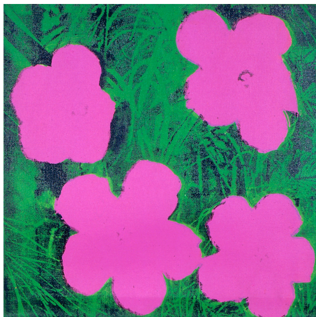
STURTEVANT, Warhol Flower, 1964-1965. Collection Frac Bretagne