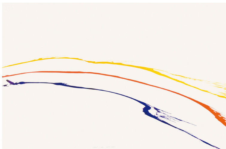
Jean Dupuy, Sans titre , avril 1966, collection Frac Bretagne © ADAGP, Paris 2023