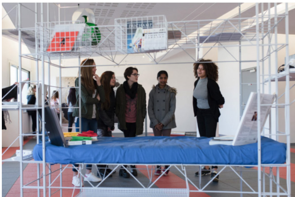
Frac Île-de-France, Exposition Impressions , 2016. Lycée Jean Vilar, Meaux.