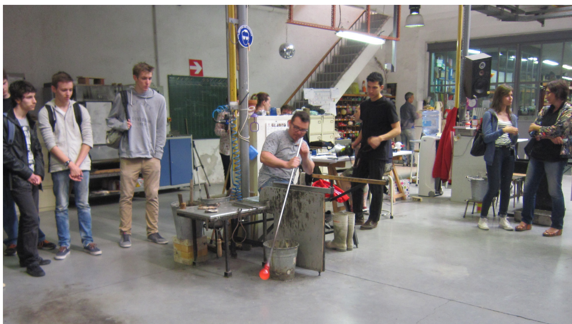
Frac Provence-Alpes-Côte d'Azur, « Frac Tour » au CIRVA, Marseille