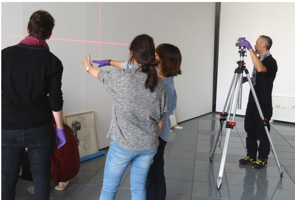
Frac Alsace, master

Le Frac a développé une programmation annuelle de stages de 2 ou 3 jours sur des thématiques telles que « L'exposition est ses enjeux », « L'ABC de l'exposition », « De la communication à la médiation », « Faire intervenir un artiste »... Le Frac Alsace met en place 8 projets accompagnés de diffusion en Région organisés pour les établissements scolaires. Suite à un appel à candidature, la sélection se fait en fonction de l'adaptabilité du lieu, du contenu du projet et de la motivation des partenaires. Le Frac demande aux partenaires sélectionnés de suivre une formation intitulée l'« ABC de l'expo ». La formation pour les partenaires scolaires dure 2 jours et est organisée en partenariat avec le Rectorat. Ces formations sont organisées à l'automne, en début de saison et avant que les prêts accompagnés en Région aient commencés. Cette formation comprend un apprentissage du commissariat et de la régie, de la médiation et des aspects administratifs.