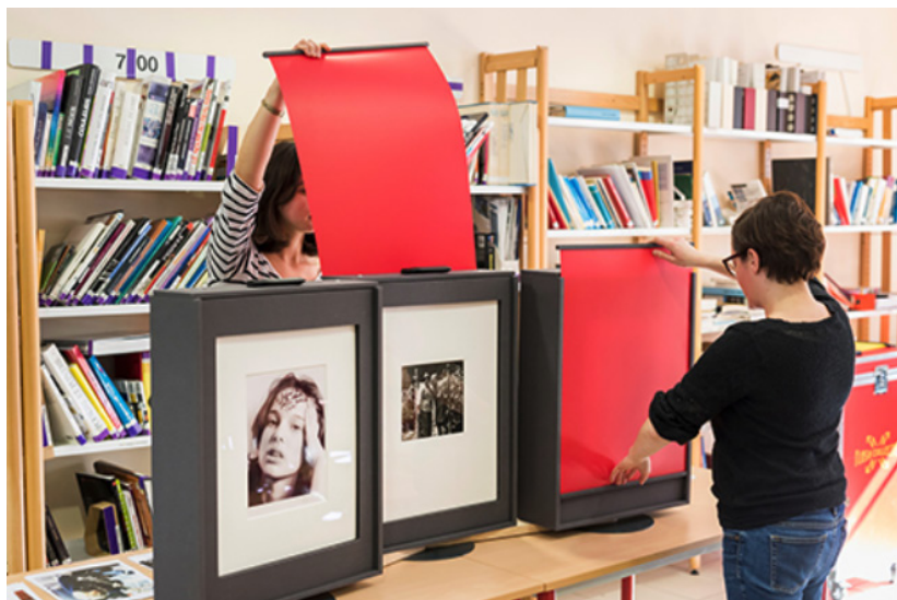
Frac Île-de-France, Flash Collection au lycée Nicolas Ledoux à Vincennes (94), 2017, design Olivier Vadrot.

Le Satellite, inauguré en 2015, est un camion aménagé en espace d'exposition, outil de diffusion conçu par l'architecte et plasticien Mathieu Herbelin. Ce dispositif original est un espace d'exposition mobile destiné à faire rayonner la collection du Frac sur le territoire régional en fonction des demandes préalables d'institutions ou d'associations locales désireuses de s'engager dans un véritable partenariat. L'exposition dans Le Satellite est accompagnée d'outils pédagogiques et de séquences de médiation. Entre 2015 et 2018, Le Satellite aura fait circuler trois expositions dans 18 communes rurales de Franche-Comté.