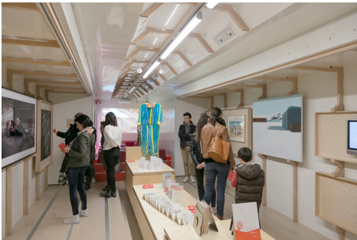
Exposition Et les enfants s'en vont devant les autres suivent en rêvant* , nov 2017-fév 2018 Avec les œuvre de la collection du Frac des Pays de la Loire