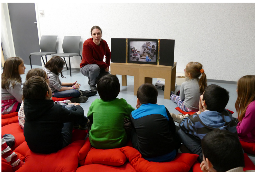
Frac Alsace, Initiation à l'art contemporain

Intervention d'un artiste dans le cadre d'ateliers de pratique artistique dans une classe (15h) mis en place en concertation avec le projet pédagogique de l'enseignante.