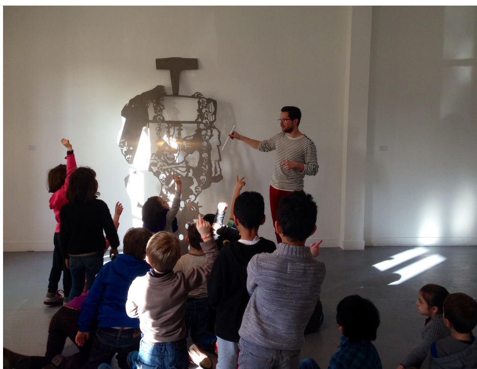
Frac Normandie Caen

Visites et ateliers pour les tout-petits. Travail en partenariat avec les réseaux d'assistantes maternelles.