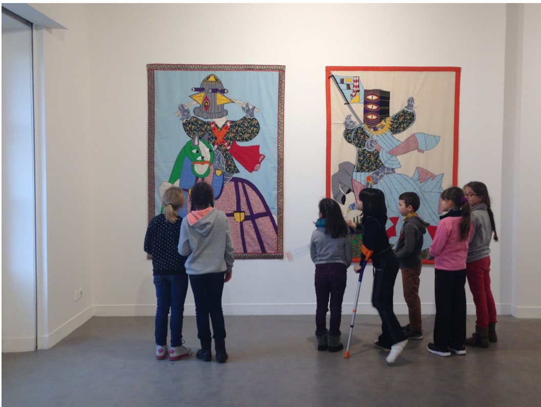
Frac Normandie Caen