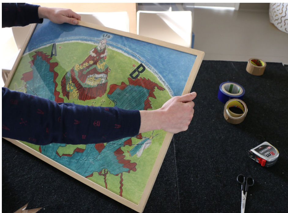
Frac Centre-Val de Loire, dispositif « Le Bureau des Cadres »

Un-e médiateur-trice se déplace en région avec une œuvre de la collection pour une séance de sensibilisation d'une heure. Un dispositif léger permettant de lutter contre l'éloignement de l'offre culturelle. L'œuvre est choisie en partenariat avec la personne relai, en fonction de son projet pédagogique.