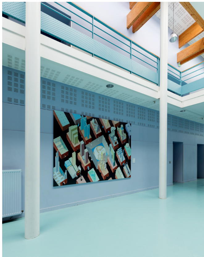
Frac Centre-Val de Loire, Lycée Gaudier-Brzeska Saint-Jean-de-Braye

Ce dispositif permet à de jeunes artistes diplômés des cinq écoles d'art de Rhônes –Alpes et d'Auvergne (Annecy, Grenoble-Valence, Lyon, Saint-Etienne, Clermont-Ferrand), de bénéficier d'une première exposition personnelle dans les conditions professionnelles de diffusion de l'art contemporain. Tous les deux ans, l'IAC organise, en collaboration avec l'Adera et en coproduction avec des structures partenaires, cinq expositions qui donnent lieu à la réalisation d'œuvres nouvelles et à l'édition d'une publication. Outil de création innovant, Galeries Nomades constitue un laboratoire mobile permettant de rendre compte de l'actualité et de la vivacité de l'art contemporain en Rhône-Alpes et désormais en Auvergne.