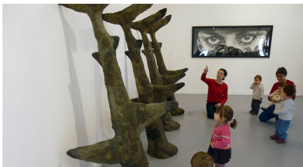
Frac Normandie Caen, lycée