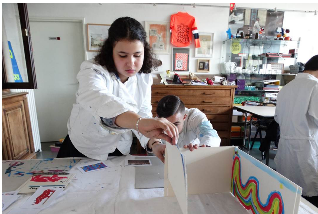
Frac Aquitaine, Atelier du Commissaire Fracasse, UPE2A Collège Francisco Goya, Bordeaux

- Etudiants en BTS Design d'Espace au Lycée Charles Coulomb, Angoulême. En 2008 : conception de projets et réalisation de mobiliers de signalétique et support de médiation pour les expositions du Frac dans le Lycée. En 2012 : conception d'un module architectural pour la présentation d'un module d'exposition d'œuvres de la collection du Frac à la Maison de l'Architecture de Poitiers. Sélection d'un corpus d'œuvres par les groupes d'élèves en fonction des contraintes techniques liées à la conservation, au transport, à la présentation des œuvres. Commissariat d'exposition à partir d'œuvres de la collection prenant en compte l'espace, le lieu. Elaboration d'une grille de mise en page et création d'une plaquette de présentation du module (classe de 1ère année de BTS). Réflexion sur une scénographie possible des œuvres sélectionnées en fonction d'un lieu : la Maison de l'Architecture à Poitiers, travail sur plans. En 2016 : conception de projets pour un aménagement des berges de Charentes entre le Frac et le CAUE prenant en compte l'accueil des publics.