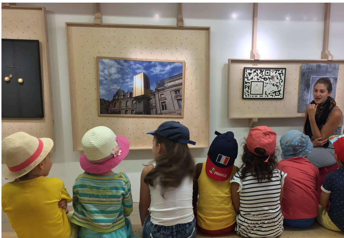
Exposition Trésors communs , juin-nov 2018 Avec les œuvre de la collection des Frac Grand Est