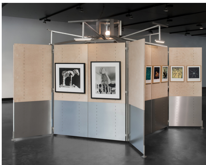
Frac Champagne-Ardenne, La Capsule à Tineux