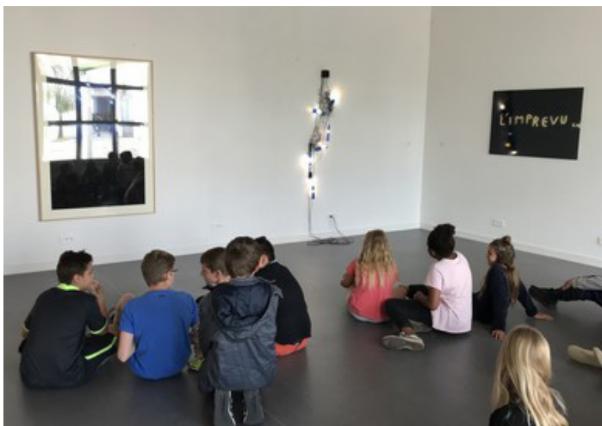
Frac Poitou-Charentes, Collège Maurice Chastang, Saint Genis De Saintonge