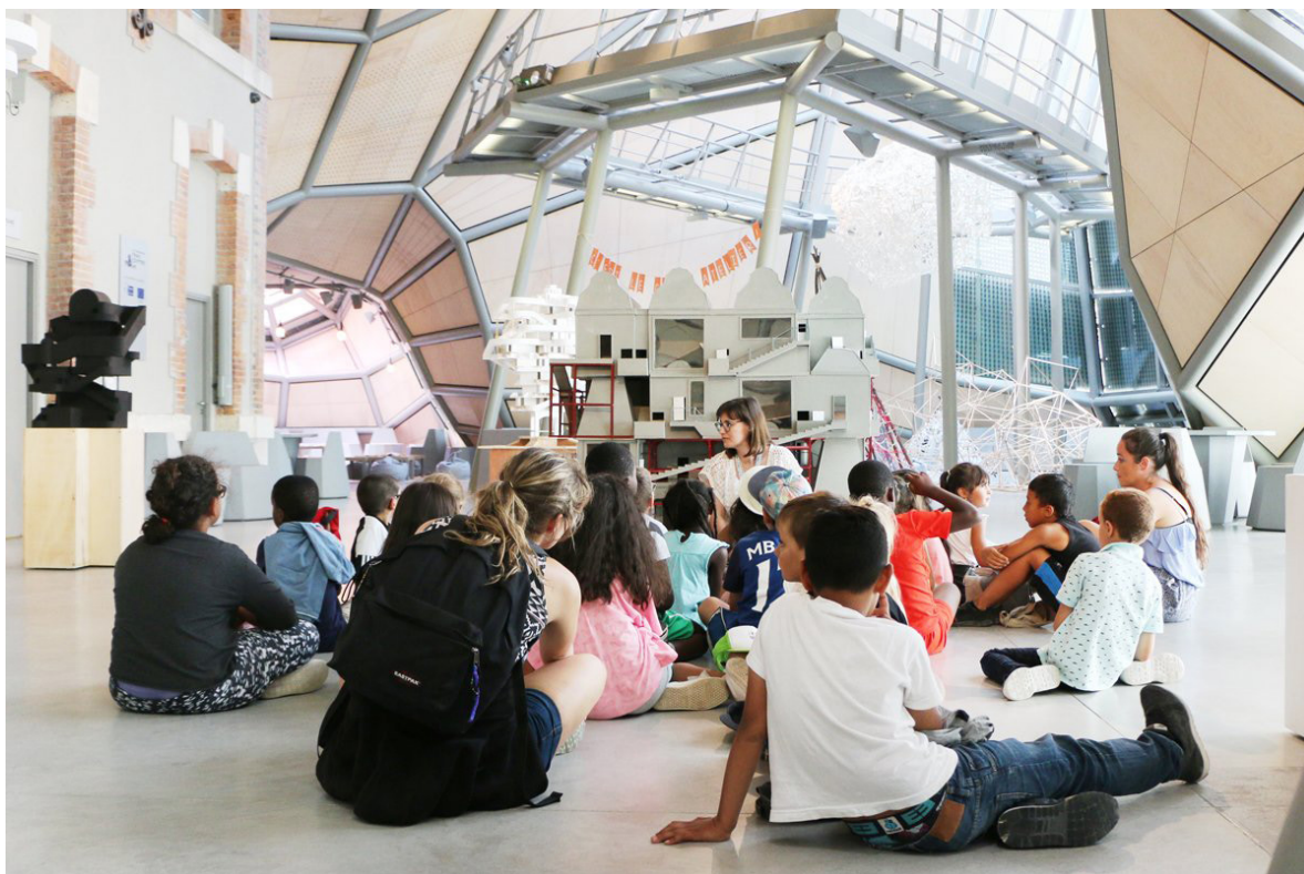
Frac Centre-Val de Loire, accueil d'un centre de loisirs venu découvrir les expositions, août 2018