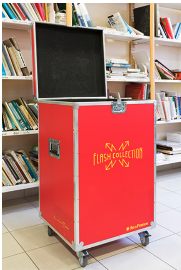
Frac Île-de-France, Flash Collection