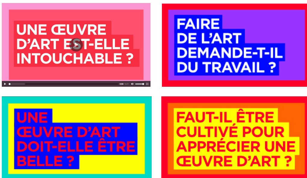
Frac Aquitaine - Série webdocumentaire « La conquête de l'art »

L'idée d'une série de web-documentaires est née du premier projet de conférences nomades et des réflexions et questionnements récurrents échangés avec les personnes et/ou publics. Il s'agit d'un outil numérique complémentaire à la conversation nomade qui pointe les freins ou préjugés liés à l'art contemporain pour mieux les interroger sur un ton à la fois sérieux et décalé. Ces webdocs sont à disposition des internautes via le site internet dédié et programmés par nos partenaires, dans le cadre des expositions hors les murs par exemple, à l'attention de leurs publics (via clef USB si pas de connexion possible). En rien exhaustifs, mais plutôt envisagés comme des invitations à faire un pas de côté, ils servent aussi de point de départ à des échanges dans le cadre de visites, formations ou rencontres professionnelles.