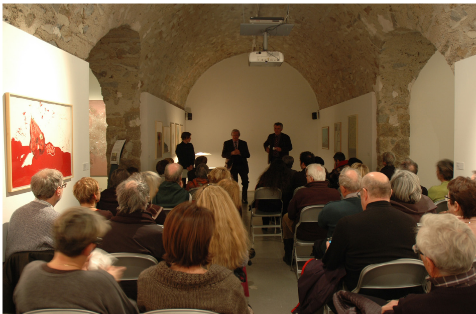
Frac-Artothèque Limousin Nouvelle Aquitaine Conférence, galerie des Coopérateurs