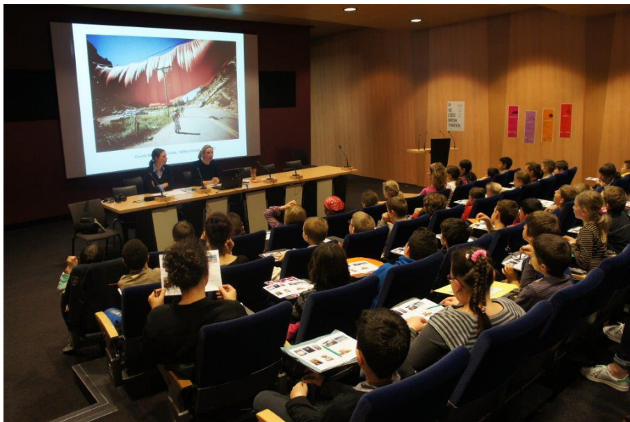
Frac Alsace, Conférence pour le jeune public, 2018.

Une heure de conférence pédagogique et ludique sur la thématique « Qu'est-ce que l'art contemporain ? » pour faire comprendre, aux élèves de cycle 3, les évolutions de l'Histoire de l'art ainsi que les nouvelles formes contemporaines.