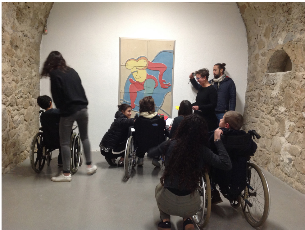
Frac-Artothèque Limousin Nouvelle Aquitaine

Le rendez spécifique «Une œuvre/une heure» : Ouvert à tous, il permet d'appréhender une œuvre installée dans le parcours de l'exposition en audio description (accessibilité public déficient visuel et intellectuel). Visite LSF ouverte à tous et gratuite : un dimanche par expo (premier dimanche du mois). D'autres visites LSF sont également proposées pour chaque exposition dans le cadre de différents projets de rencontre des publics.