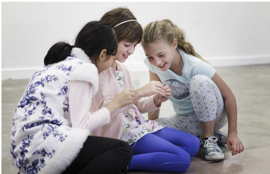
Frac Auvergne, atelier

Le frac île-de-france donne régulièrement carte blanche à un artiste pour la réalisation d'un projet partagé et ouvert à tous dans le cadre de l'antenne culturelle. Les publics adultes qui souhaitent s'engager dans le groupe se constituant alors sont invités à participer aux différentes étapes du projet. Sur quelques semaines, les différents rendez-vous ont généralement lieu en soirée, afin de permettre aux volontaires d'y prendre part. Sur le modèle des ateliers de pratique amateur, ce programme permet ainsi à tout un chacun d'établir un rapport « actif » à la création contemporaine.