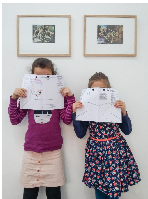
49 Nord 6 Est - Frac Lorraine Outil de médiation LoRA

Qui proposent un parcours de visites d'expositions dans les lieux culturels de proximité et ainsi de découvrir différentes typologies de lieux (ateliers d'artistes, galeries, musée, associations culturelles...) et les différents métiers liés à la création contemporaine en passant par des ateliers de pratique artistique. Les visites se construisent en collaboration avec les équipes du Frac et l'équipe éducative de façon à construire un programme adapté au projet pédagogique des enseignants.