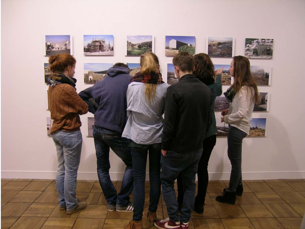
Frac Normandie Caen

Chaque année des étudiants de l'EESI sont formés à la médiation de l'art contemporain et à la régie d'exposition. De plus, le dispositif « Une heure une œuvre » permet la médiation et des visites accompagnées des expositions du Frac pour les étudiants dans le cadre de leur formation : « Rencontre avec l'autre et altérité ».