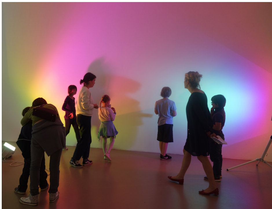
IAC - Visites « Family Sunday »