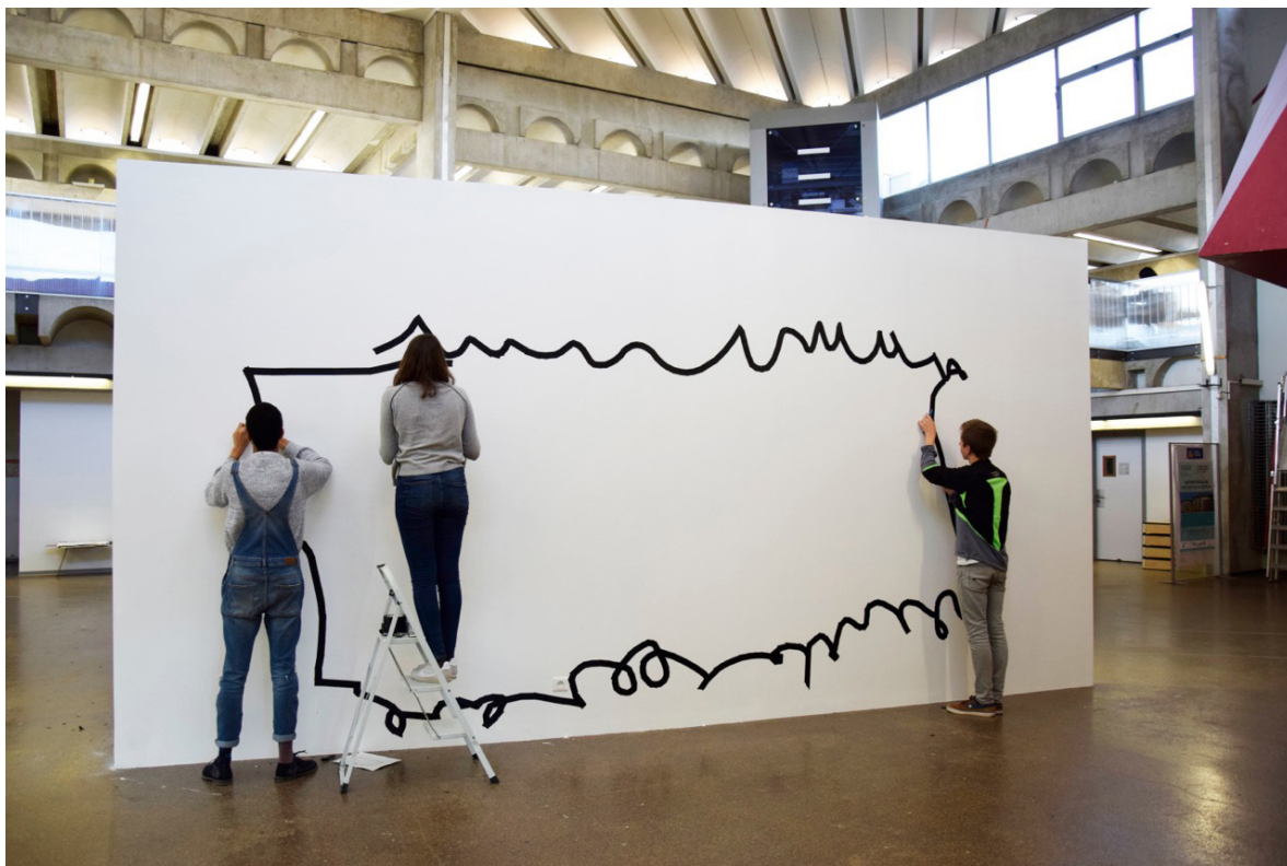
Frac Occitanie Montpellier, École nationale d'enseignement supérieur en architecture de Montpellier dessin Hirayama, 2017