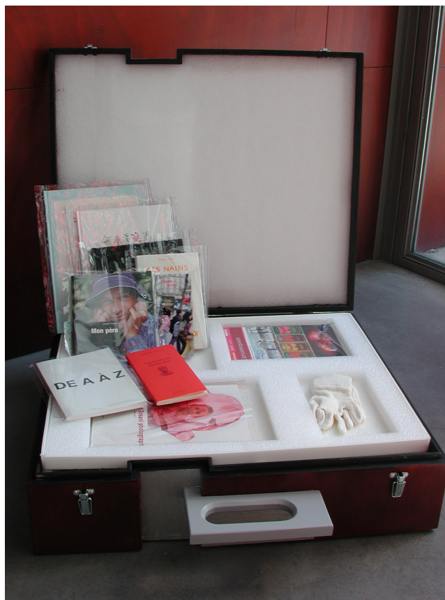
Frac des Pays de la Loire, outil nomade de médiation

Depuis 2003, ce dispositif favorise la diffusion en milieu scolaire. Collèges et lycées accueillent dans leur établissement une œuvre de la collection pendant un mois. La sélection a lieu en septembre au Frac pendant le cycle de l'exposition l'Inventaire. Une cinquantaine d'établissements participent chaque année à cette action, dont certains en zones rurales éloignées de toute offre culturelle. Un blog dédié permet une mise en commun des exploitations pédagogiques autour de l'opération par les enseignants.