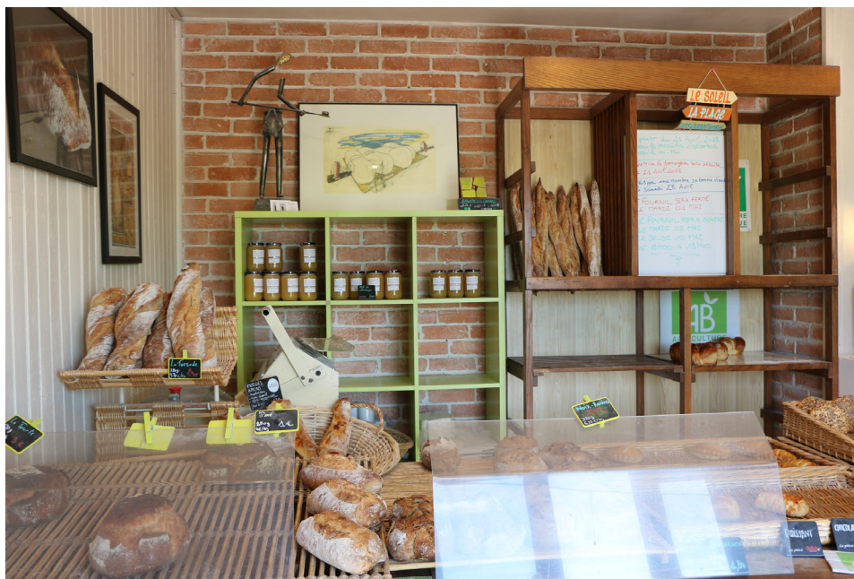
Frac Centre-Val de Loire, dispositif « Les Nouveaux Commanditaires »

Chacun (public, privé) peut désormais emprunter un des cent fac-similés d'œuvre de la collection du Frac et l'installer chez lui pour une durée de deux mois. « Le Bureau des Cadres » est un dispositif fondé sur l'échange et le prêt d'œuvres à destination des particuliers. L'expérience peut se poursuivre avec le dispositif « Intérieurs » : le Frac propose à chacun de s'appropriier la collection en transformant son espace de vie ou de travail en lieu d'exposition accessible au public. Des habitants, commerçants, entreprises... vous invitent chez eux pour découvrir une œuvre de la collection.