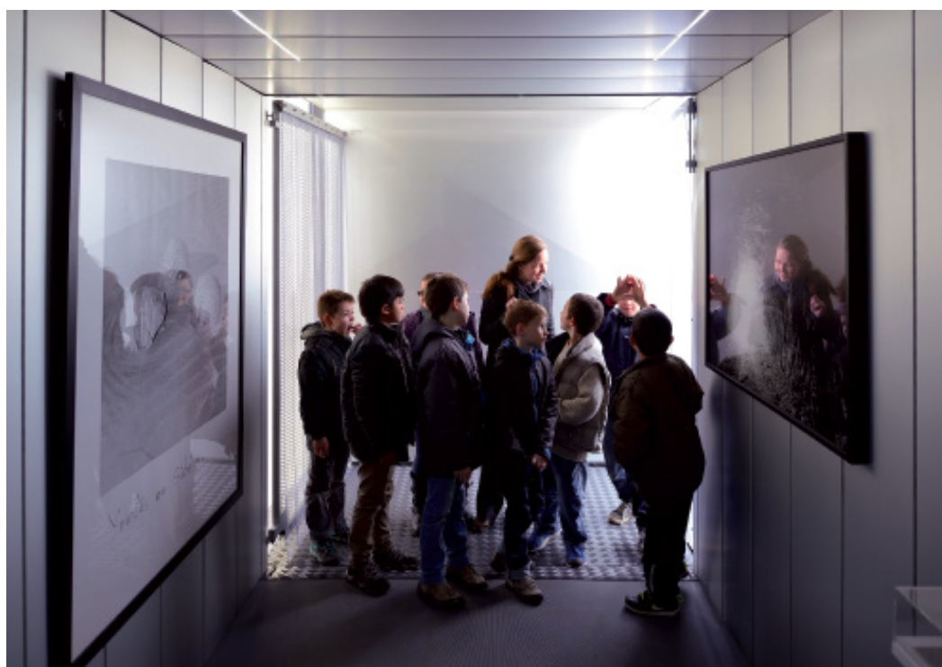
Frac Franche-Comté Le Satellite