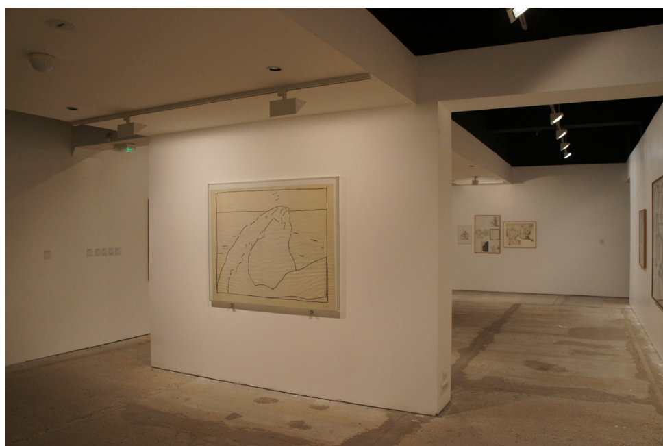
Frac Picardie - des mondes dessinés