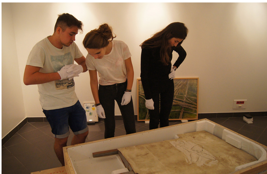
Frac des Pays de la Loire, Montage de l'exposition Migrations , Lycée Notre Dame, Challans

Ce projet est proposé aux écoles, collèges, lycées et structures d'accueil de l'enfance et de l'adolescence sur la base d'un « aller-retour » entre le Frac et la structure. Le groupe découvre une sélection d'œuvres au Frac ou par l'intermédiaire de Navigart pour y choisir des œuvres qui feront l'objet d'une exposition dans leur espace. Depuis la conception jusqu'à la médiation, le groupe est acteur de la mise en place de l'exposition ponctués de rencontres avec les professionnels du Frac.