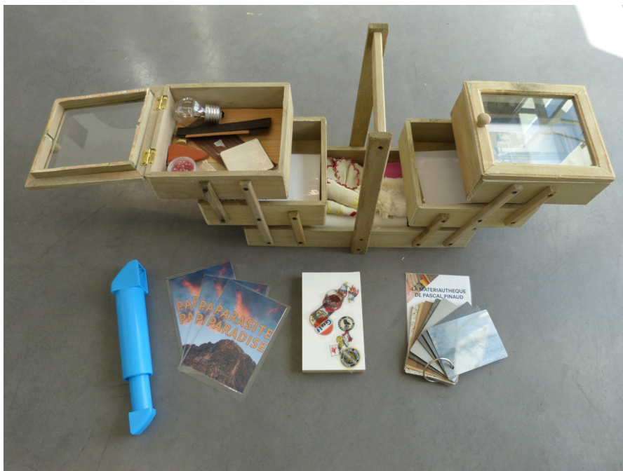
Frac Provence-Alpes-Côte d'Azur Des outils sur mesure autour des expositions

Refonte du site internet : La refonte récente du site a été pensée pour permettre au public d'accéder de manière plus active et didactique au fonds et télécharger facilement l'ensemble des documents de communication. Un onglet spécial donne, au public en situation de handicap, un accès plus simple et direct au programme.