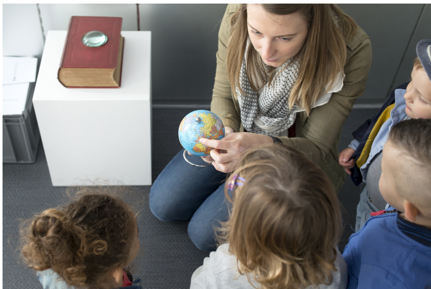
Frac Franche-Comté, Le Satellite