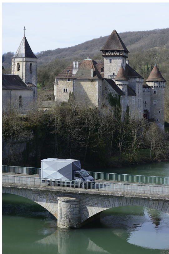
Frac Franche-Comté Le Satellite