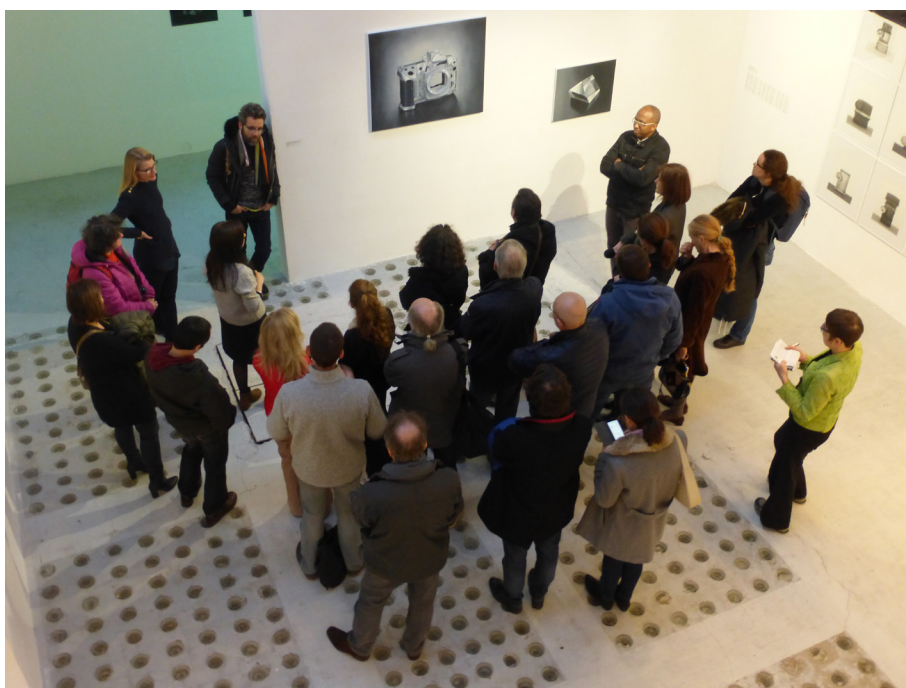
Frac Normandie Rouen

Conversation nomade sur le territoire : pensée initialement sous forme d'une conférence avec une historienne de l'art puis avec une philosophe, la conférence nomade s'est transformée en conversation orchestrée par une artiste, plus interactive avec les participants. Ce dispositif d'écoute et de partage mutuels peut accompagner les expositions sur le territoire ou bien être programmé de manière autonome dans des structures culturelles, éducatives ou sociales. L'activation de la parole et le travail de l'attention sont au cœur de cette proposition sur des sujets relatifs à l'art contemporain (ex : le travail de l'artiste, la question de la beauté, la réception des œuvres, le rapport au savoir...). L'artiste communique avec la personne référente du lieu d'accueil pour ajuster les contenus.