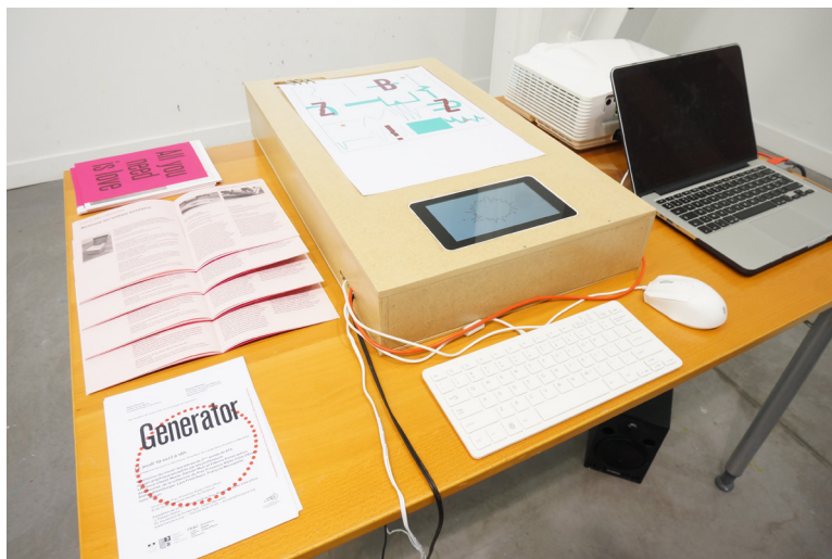
Frac Provence-Alpes-Côte d'Azur Le Generator

Entièrement pensé et réalisé par des élèves de BTS Arts Appliqués du lycée Saint Exupéry à Marseille, le Generator est à la fois un dispositif de médiation interactif et un outil de création. Les étudiants se sont inspirés d'une sélection d'œuvres de la collection du Frac avant d'en proposer une réinterprétation graphique. Le Generator permet à l'utilisateur de créer une composition à partir de ces différents motifs, et de produire une affiche via un procédé sérigraphique. Au-delà de l'affiche, un dispositif électronique permettra d'activer une bande sonore donnant des informations sur l'œuvre originale.