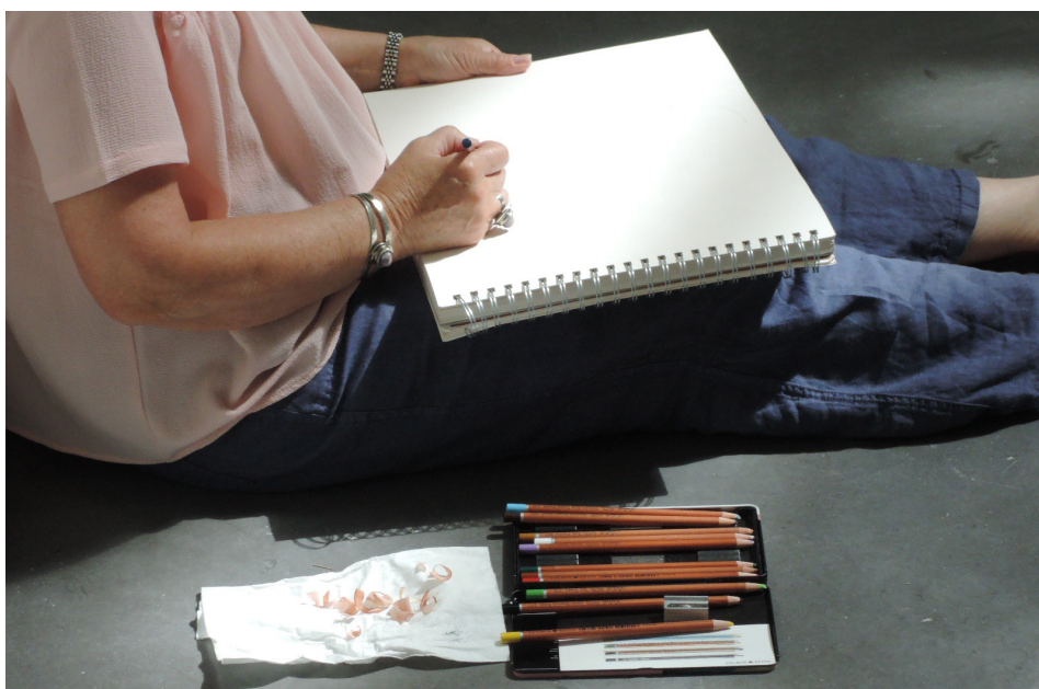
Frac Poitou-Charentes, Ateliers d'écriture