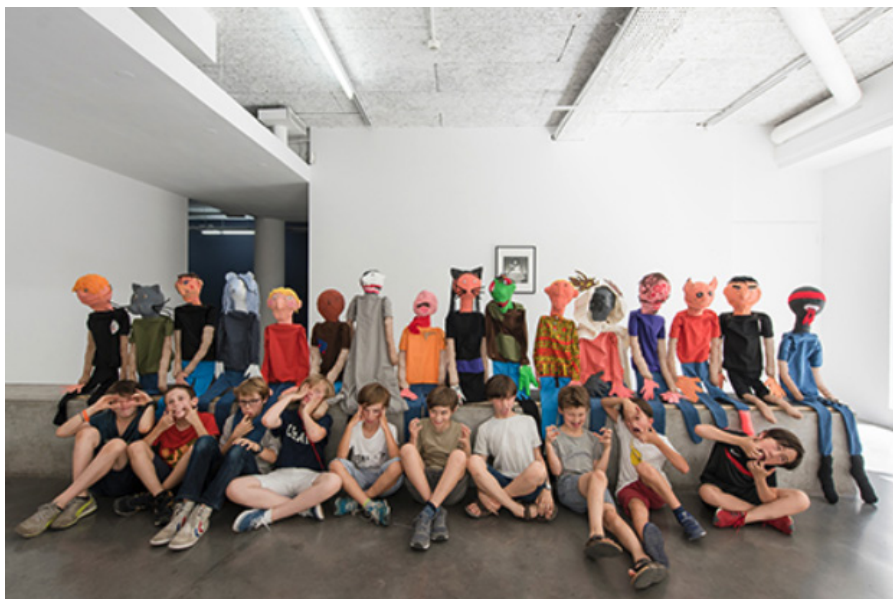
Frac Île-de-France, ateliers thématiques