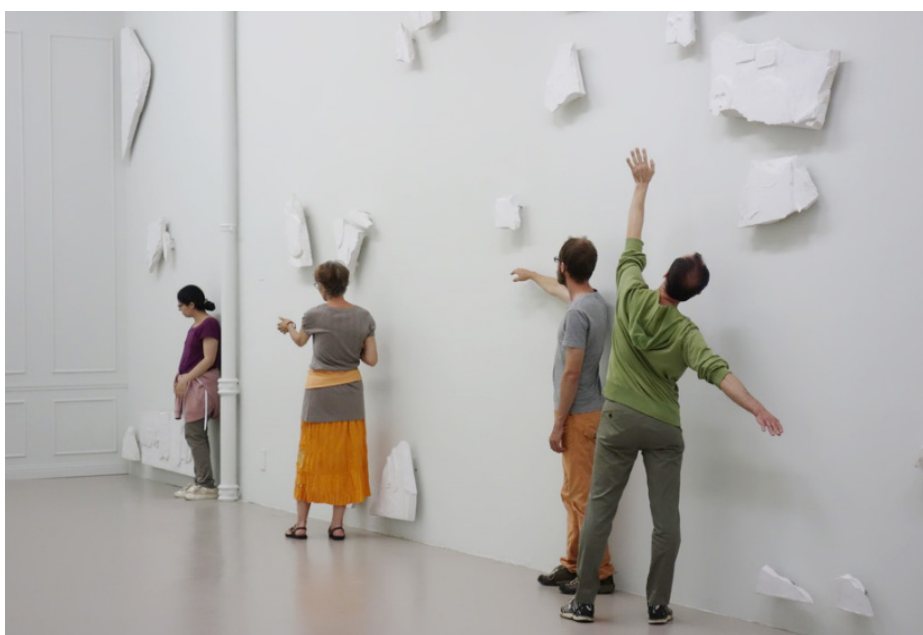
IAC - Visites « Postures à l'œuvre »

Chaque visite est accompagnée d'une découverte de l'art contemporain par le livre. Livre d'artiste, édi-tions, multiples, et ouverture sur le littérature de jeunesse.