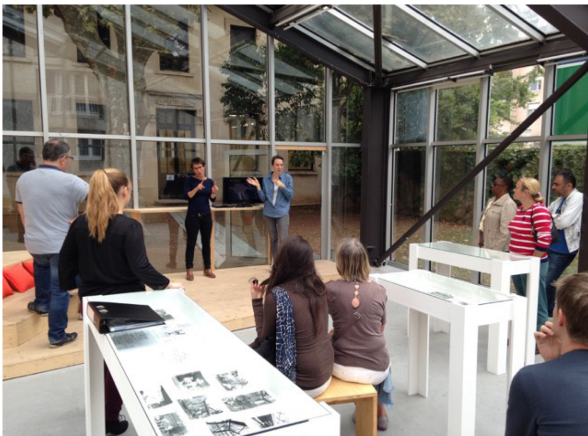
IAC, visite en LSF