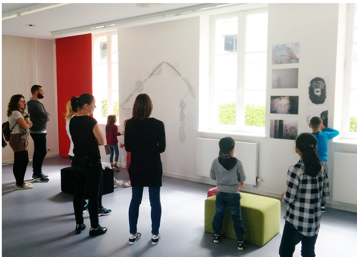
49 Nord 6 Est – Frac Lorraine, Le club des chercheurs

Réseau d'échanges réciproques de savoirs et de création collective, l'association Résonnance propose aux participants des ateliers d'écriture. Ces ateliers sont repérés par les participants comme des « espaces-temps » consacrés à l'expression de soi par l'écriture et la lecture. Ils sont également le lieu d'exploration de la langue Française, de ses difficultés, de ses subtilités. Les participants sont régulièrement accueillis par un-e médiateur-trice dans les expositions du FRAC. Cela donne lieu à des ateliers d'écriture à partir des œuvres et des thèmes des expositions Université du temps libre d'Angoulême : Comités de quartier.