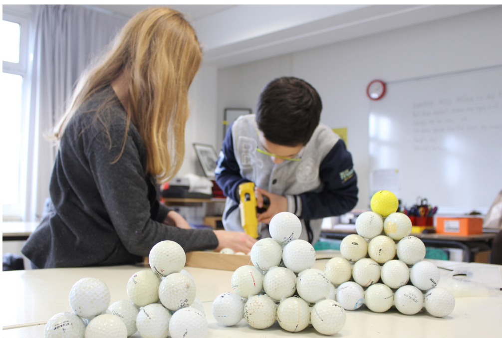
Frac Normandie Caen, Résidences