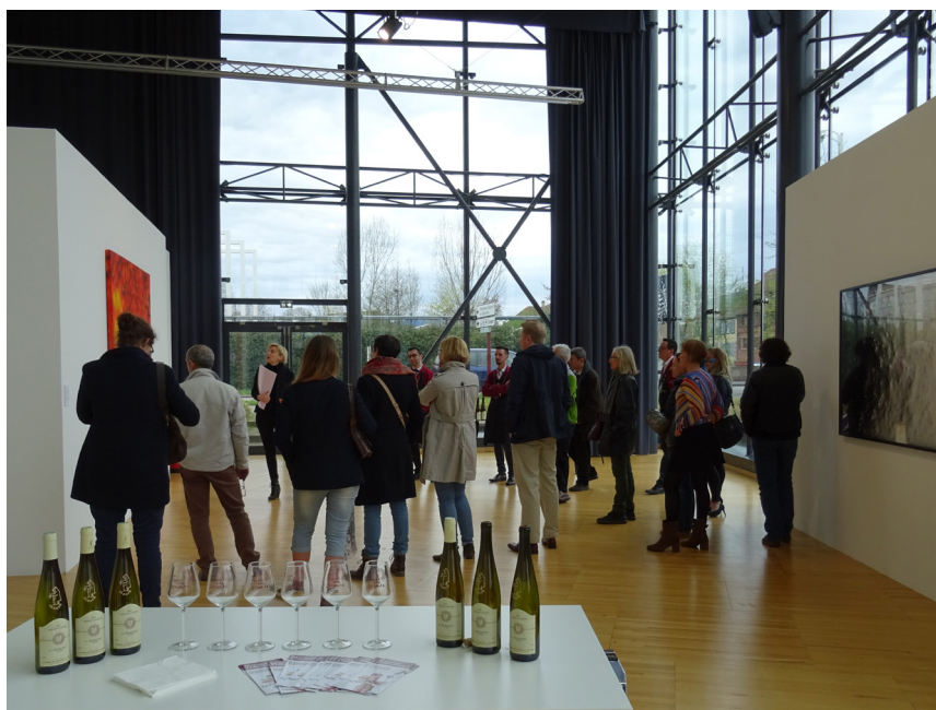
Frac Alsace, Soirée dégustation « Vin Art contemporain », 2018

Projet participatif en cours impliquant deux collections, avec le Musée de la Bande Dessinée d'Angoulême (Cité Internationale de la Bande Dessinée et de l'Image) avec des publics des Maisons de solidarité, dans le cadre de la Politique de la Ville.