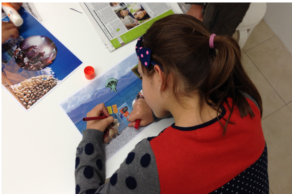
Frac Bourgogne, Atelier pratique dans le cadre de l'exposition Tulkus 1880 to 2018 - Paola Pivi