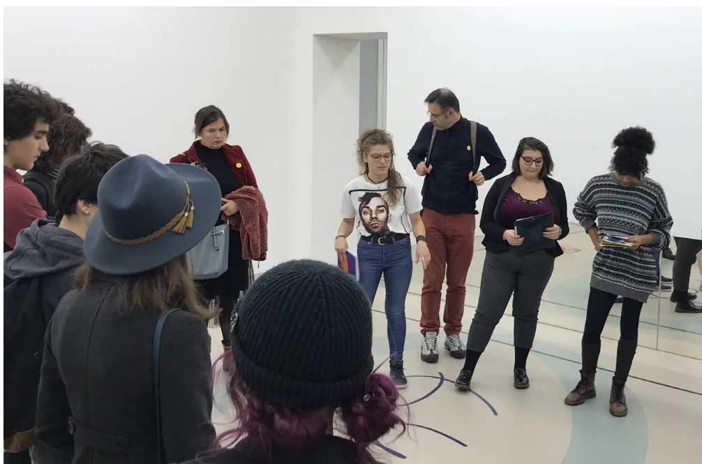
IAC, « E-Studio »

Diffusion des informations concernant les scolaires et les publics en situation de handicap... Autres projets à venir.