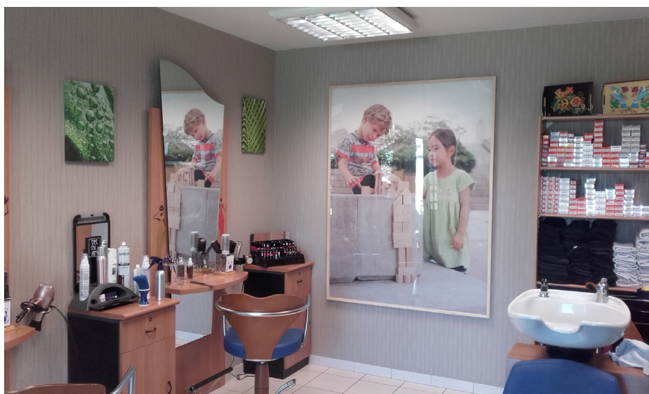
Frac-Artothèque Limousin Nouvelle Aquitaine Œuvre d'Aurélien-Froment exposé au Salon de coiffure de Royere, 2018