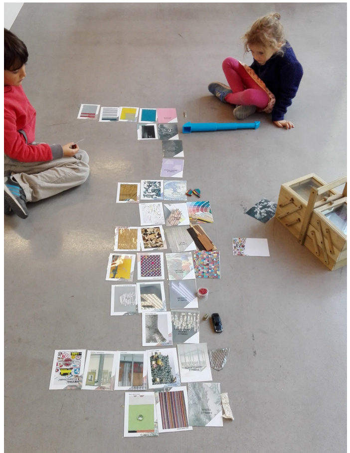
Frac Provence-Alpes-Côte d'Azur : « La Nouvelle Vague »