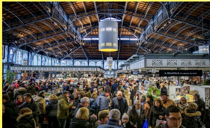
Les halles centrales de Limoges

Avec l'Opéra, le Théâtre de l'Union - Scène Nationale, trois musées dont le musée national Adrien Dubouché, une biennale de danse contemporaine, un festival de jazz et le festival des Francophonies, Limoges est aussi reconnue pour sa scène culturelle et sa convivialité