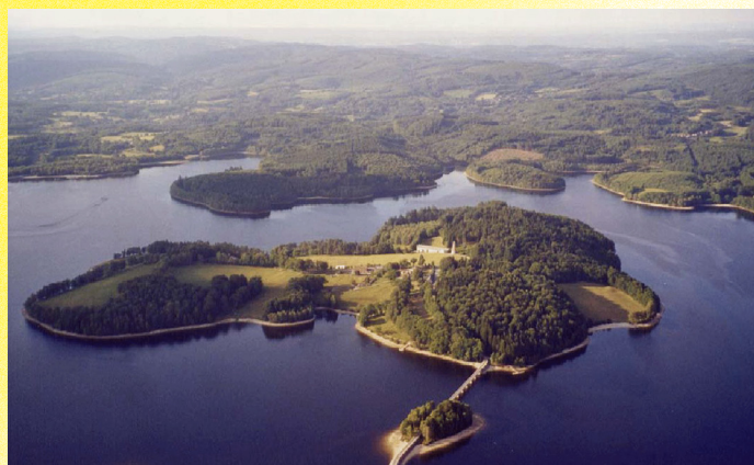
Île de Vassivière (Creuse)

Située en plein cœur d'une région magnifique, à 3 heures de Paris, à 2h30 de Bordeaux, Toulouse et de l'océan, Limoges bénéficie d'un cadre de vie apaisé et d'un environnement naturel exceptionnel.