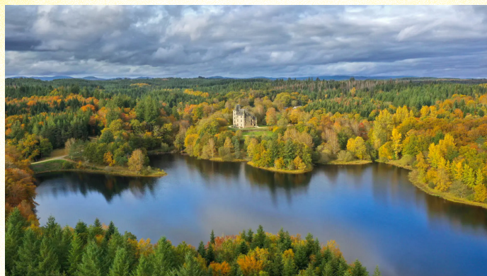
Château de Sédrières (Corrèze)

La Région Nouvelle-Aquitaine place la création au cœur de sa stratégie de développement culturel et économique. C'est dans ce contexte que se développe le projet artistique et culturel du Frac-Artothèque Nouvelle-Aquitaine qui ouvrira un nouveau site au printemps 2023 en hyper-centre de Limoges dédié à la création contemporaine.