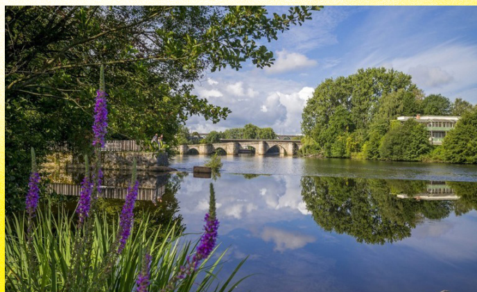
Les bords de la Vienne, Limoges