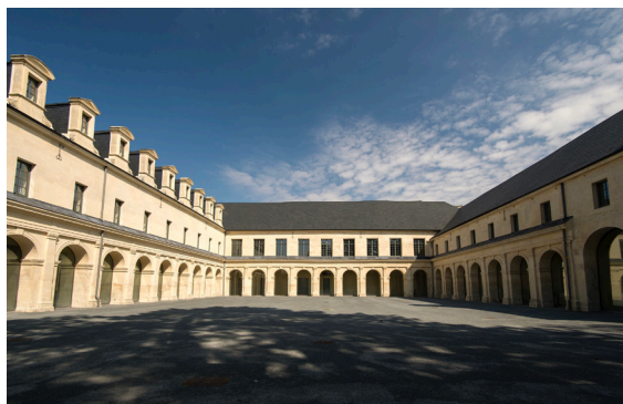
Cour intérieure du Frac Normandie Caen

Aujourd'hui, l'engagement du Frac Normandie Caen acquiert une reconnaissance nationale et régionale en se voyant attribuer la marque d'État Tourisme & Handicap pour les quatre familles de handicap ainsi que le Label Droits Culturels décerné par la Région Normandie.