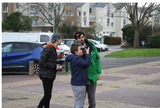
Résidence de Simon Boudvin en partenariat avec l'IME l'Espoir et le PALMA Festival, 2019

Les actions citées ci-dessus se développent dans une large partie du territoire normand. Le Frac initie des partenariats dans les « zones blanches » éloignées de l'offre culturelle (territoires ruraux, quartiers prioritaires).