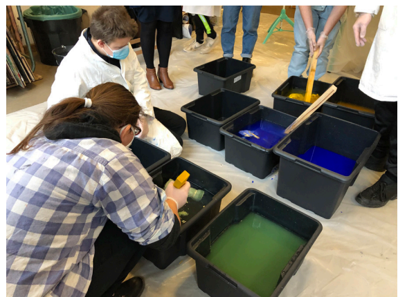
Résidence de Nine Hauchard en partenariat avec l'IME l'Espoir et l'ésam de Caen/Cherbourg, 2021