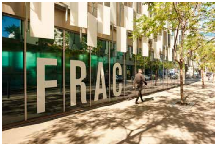
Photo : Frac Provence-Alpes-Côte d’Azur / Laurent Lecat, septembre 2020.

Le Frac Provence-Alpes-Côte d’Azur — équipement exceptionnel de la Région Sud —, a besoin d’un projet fidèle à l’ambition qui le porte depuis sa création en 1982 ; ambition renouvelée en 2013 par l’inauguration de son nouveau bâtiment à l’architecture iconique. Il doit fédérer les énergies, réunir les acteurs artistiques et culturels régionaux, ouvrir la voie à des projets innovants et valoriser la richesse de la scène artistique sur son territoire, ainsi qu’au niveau national et international.