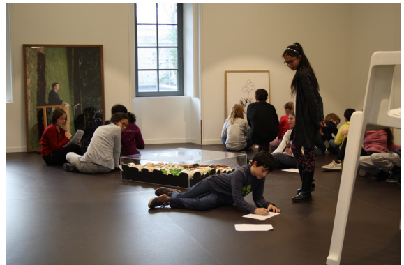
Projet « Double Sens » avec le collège de Mondeville : sélection des œuvres au Frac, 2019