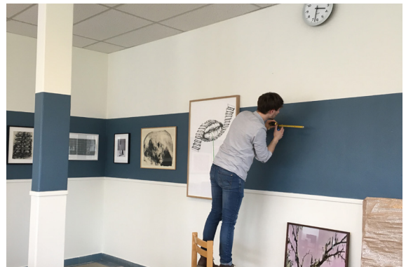
Projet « Double Sens » : montage de l'exposition à l'école de Douvres-la-Délivrande, 2018