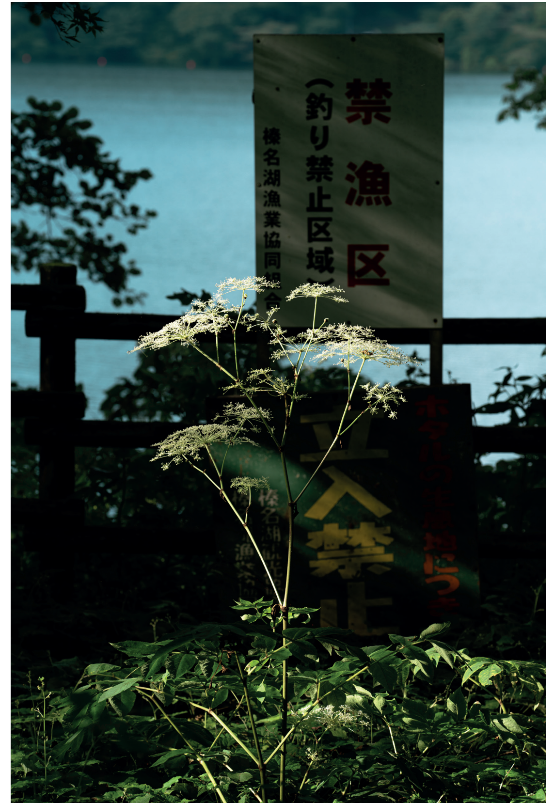
Hideki Umezawa, Haruna Lake # 2 , 2021

Fidèles au principe de décentralisation qui a présidé à la création des Frac, les projets dans et hors les murs du Frac Sud inviteront à « se décentrer » au sens propre comme au figuré. Les coproductions et itinérances envisagées à l'étranger pour ces expositions, renforceront le rayonnement international du Frac Sud après deux années événementielles qui ont largement consolidé son assise régionale et nationale.