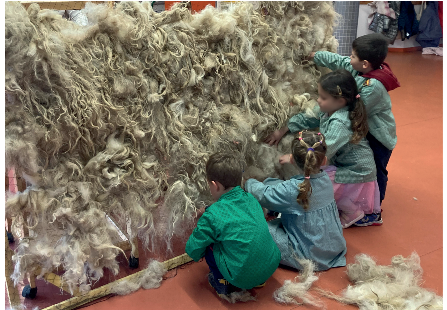
Ateliers avec Louis Lefebvre en partenariat avec le Parc Naturel Région des Préalpes, 2025.

Enfin, le Frac Sud s'engage à créer des liens durables avec les publics éloignés des institutions culturelles, en développant des projets sur mesure avec des structures sociales, éducatives ou associatives.