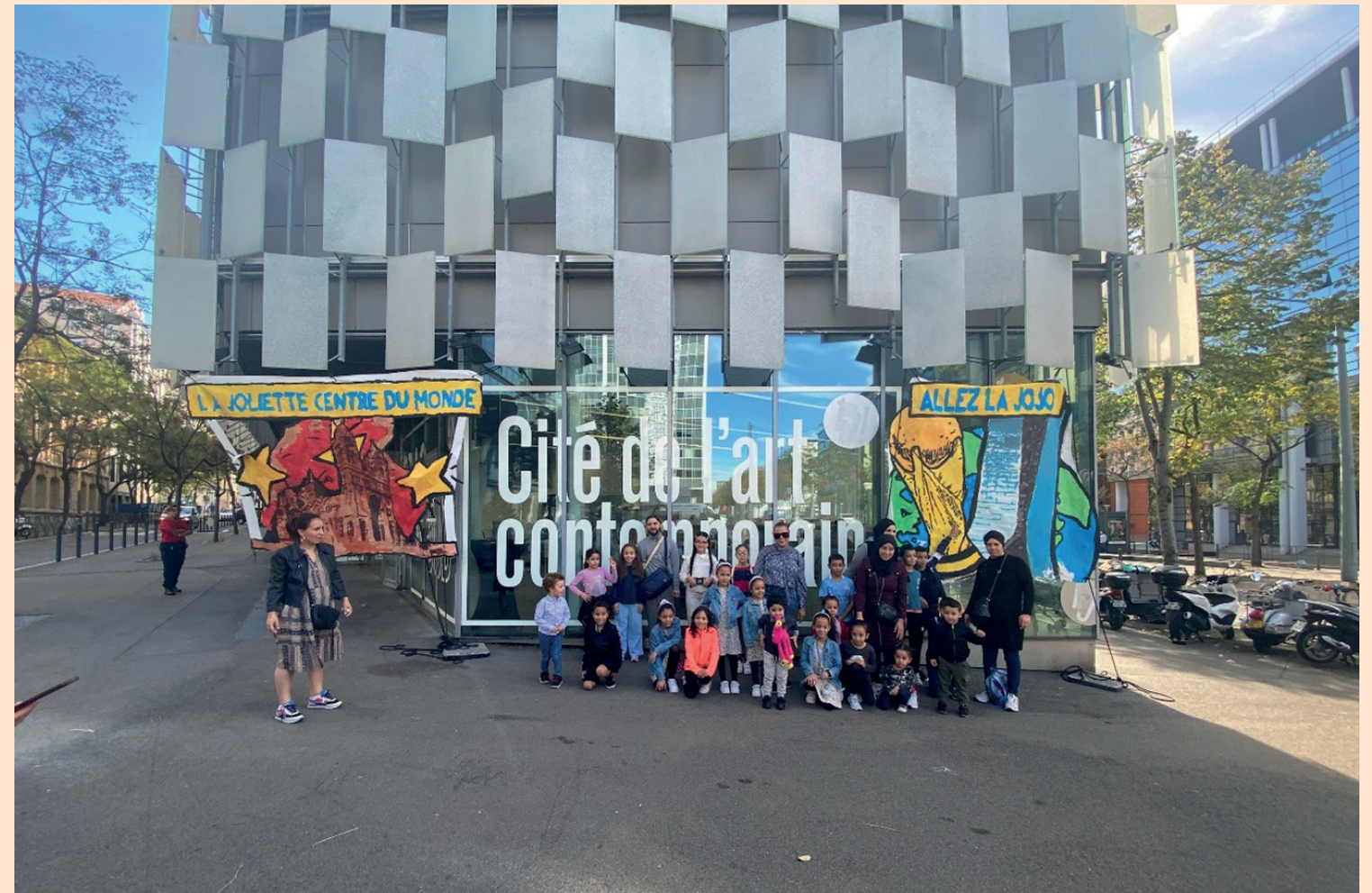
Biennale de la Joliette, 2023

La Biennale de la Joliette 2025 – Complicités en lumière est un projet culturel de territoire initié par le Frac Sud. Pensée comme un rendez-vous participatif, elle valorise les initiatives artistiques, sociales et citoyennes du quartier de la Joliette à Marseille. Cette seconde édition, à l'automne 2025, met en lumière des projets coconstruits avec les habitants, associations, structures culturelles, commerçants et institutions. Portée par une gouvernance souple et inclusive, la Biennale de la Joliette favorise le dialogue, la création partagée et la coopération locale. Elle s'inscrit dans une dynamique de long terme autour des droits culturels et du vivre-ensemble.