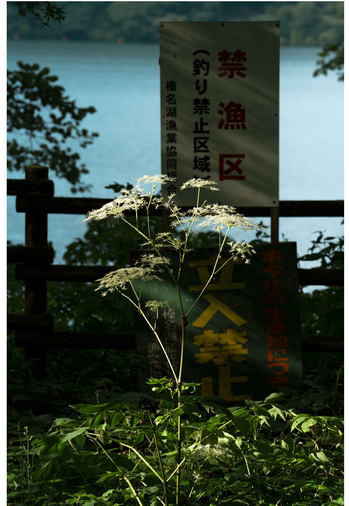
Hideki Umezawa, Haruna Lake # 2 , 2021

Fidèles au principe de décentralisation qui a présidé à la création des Frac, les projets dans et hors les murs du Frac Sud inviteront à « se décentrer » au sens propre comme au figuré. Les coproductions et itinérances envisagées à l'étranger pour ces expositions, renforceront le rayonnement international du Frac Sud après deux années événementielles qui ont largement consolidé son assise régionale et nationale.