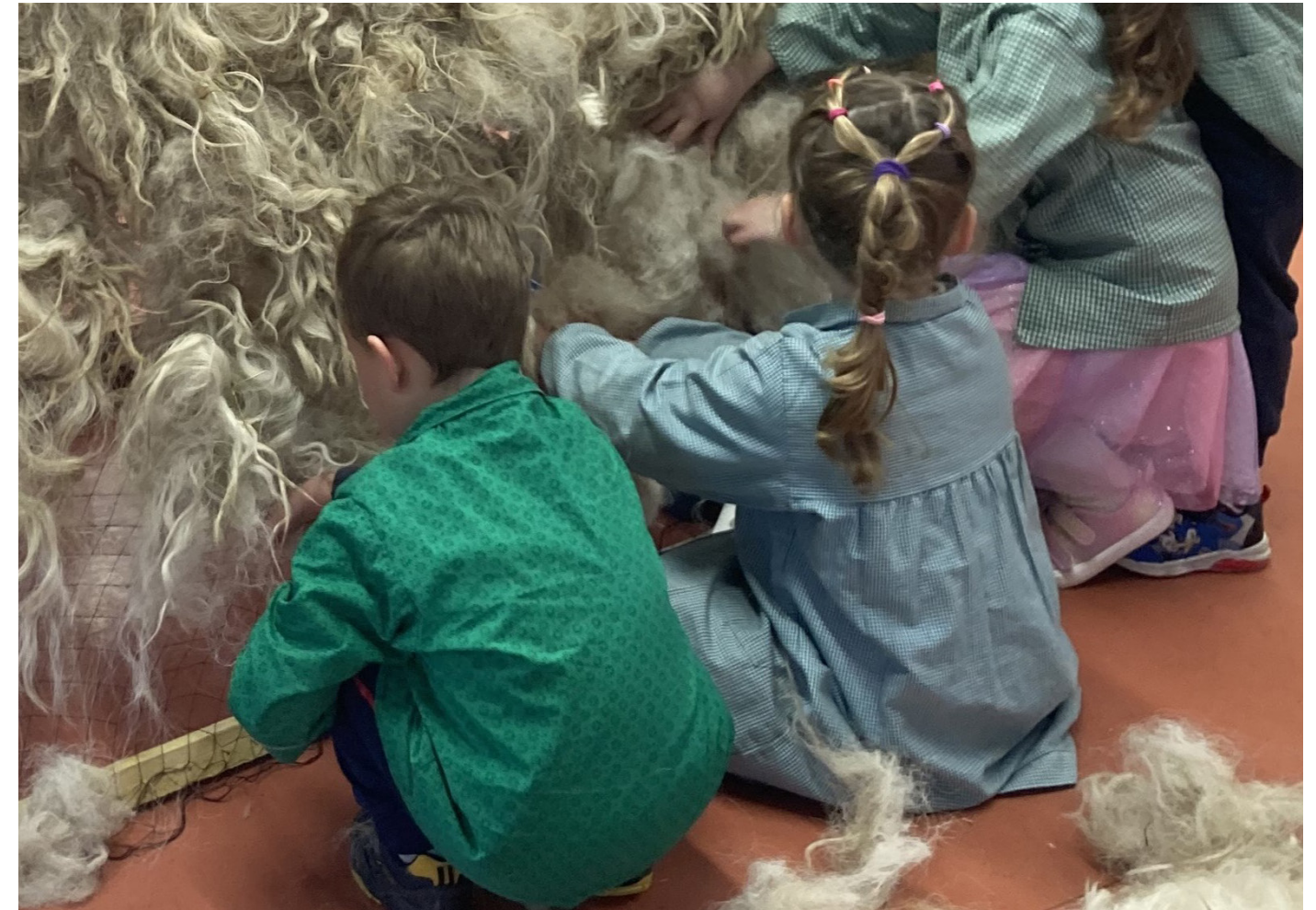
Ateliers avec Louis Lefebvre en partenariat avec le Parc Naturel Région des Préalpes, 2025.

Enfin, le Frac Sud s'engage à créer des liens durables avec les publics éloignés des institutions culturelles, en développant des projets sur mesure avec des structures sociales, éducatives ou associatives.