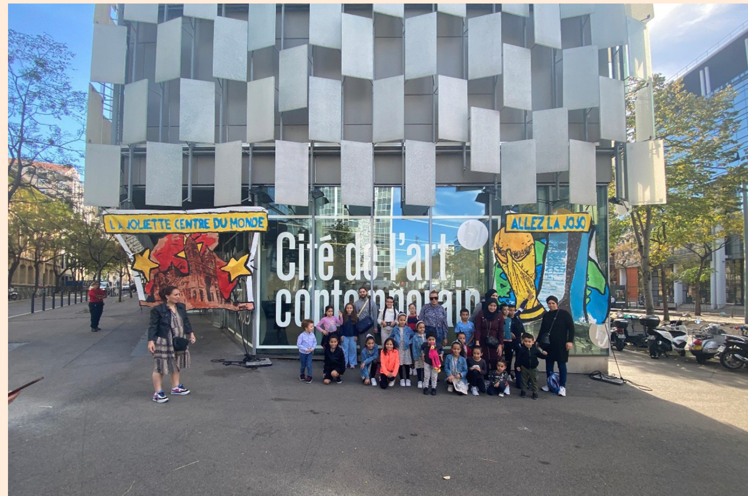
Biennale de la Joliette, 2023

La Biennale de la Joliette 2025 – Complicités en lumière est un projet culturel de territoire initié par le Frac Sud. Pensée comme un rendez-vous participatif, elle valorise les initiatives artistiques, sociales et citoyennes du quartier de la Joliette à Marseille. Cette seconde édition, à l'automne 2025, met en lumière des projets coconstruits avec les habitants, associations, structures culturelles, commerçants et institutions. Portée par une gouvernance souple et inclusive, la Biennale de la Joliette favorise le dialogue, la création partagée et la coopération locale. Elle s'inscrit dans une dynamique de long terme autour des droits culturels et du vivre-ensemble.