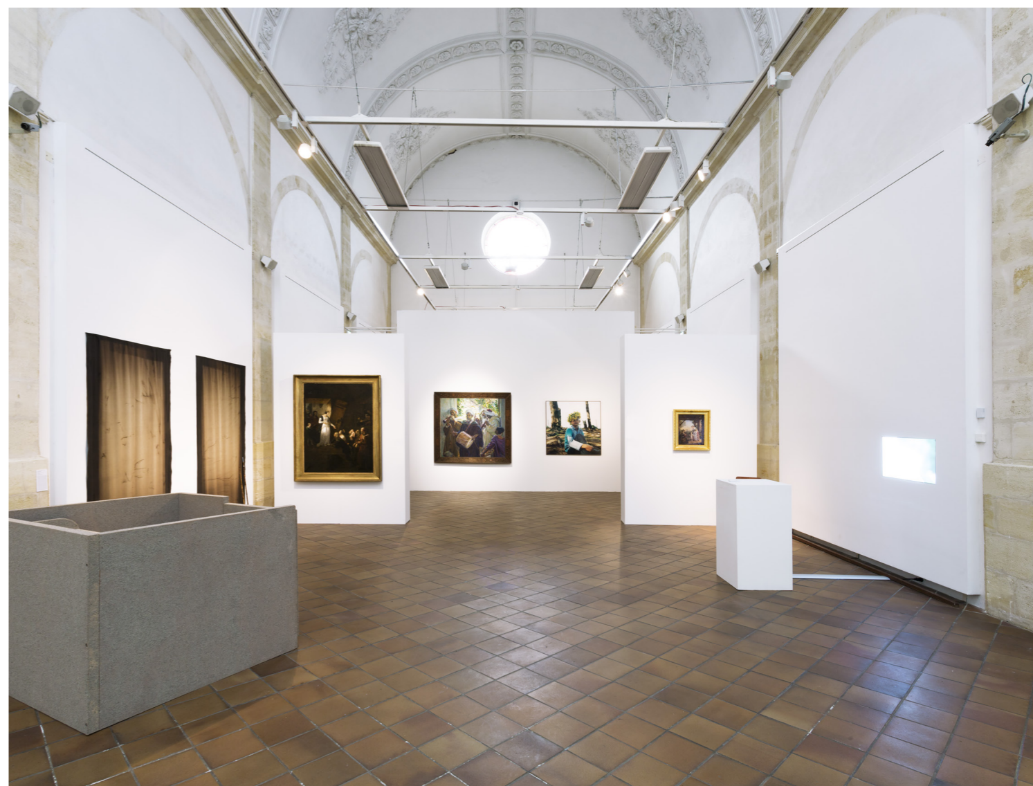
Exposition « Confidentielles », Chapelle du Carmel, Libourne, en partenariat avec le Musée des Beaux-Arts de Libourne, 2023.

Une publication rassemble l'ensemble de ces projets et contributions, parue en 2022 en coédition Frac MÉCA / Actes Sud. Sans viser l'exhaustivité, la multiplicité des points de vue rassemblés dans ce livre souligne le chemin parcouru et celui qu'il reste à faire pour atteindre une coexistence des femmes et des hommes plus juste et plus représentative dans le domaine de la création.