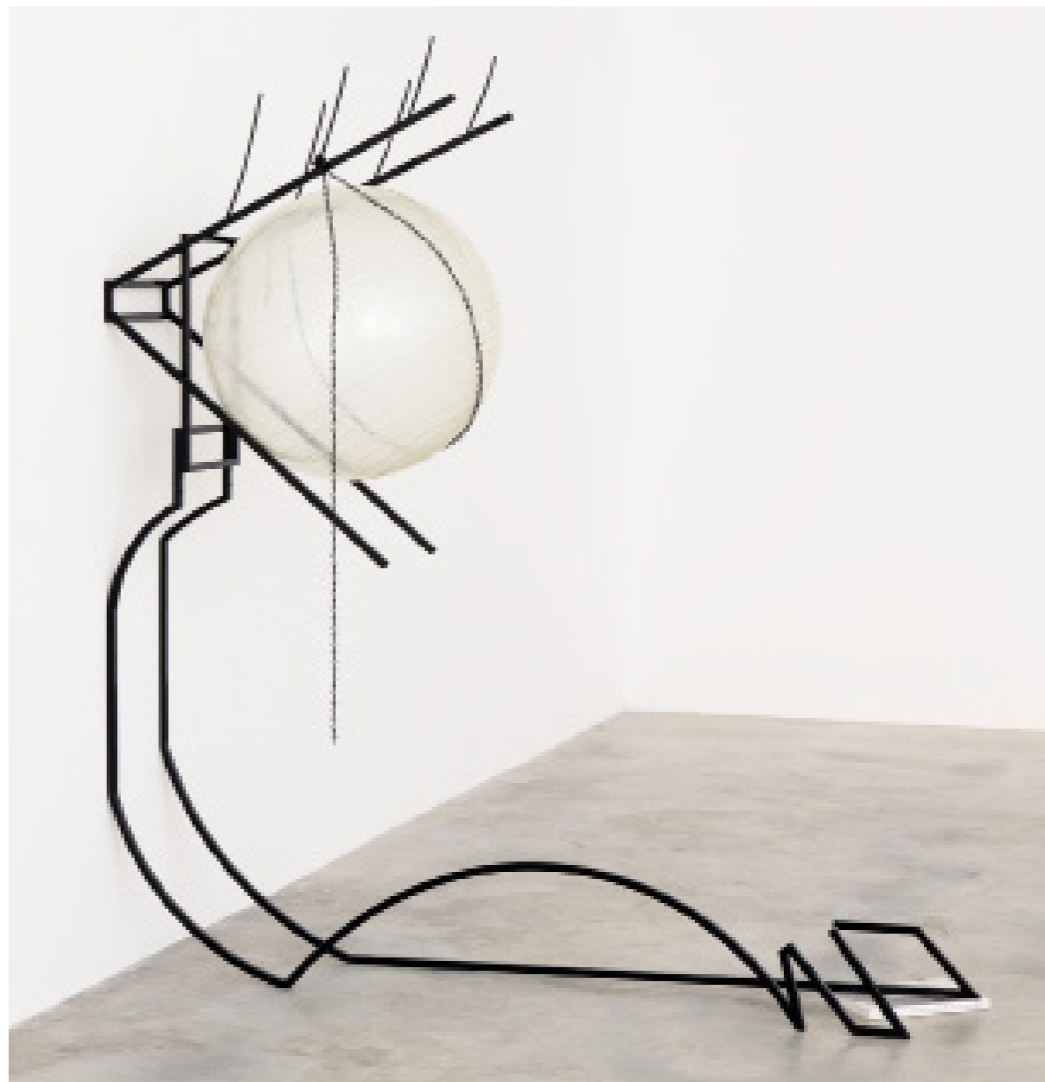
Julie BÉNA, Eternal Beauty , 2018, Collection Frac MÉCA © Adagp, Paris, 2026.

Ce projet est soutenu par le ministère de la Culture dans le cadre du plan « Mieux produire, mieux diffuser à l'international » pour une durée de 5 ans et est piloté conjointement par les principaux acteurs français de la coopération et de la mobilité internationales : l'Institut français, l'Office national de diffusion artistique, Relais Culture Europe et On the Move.