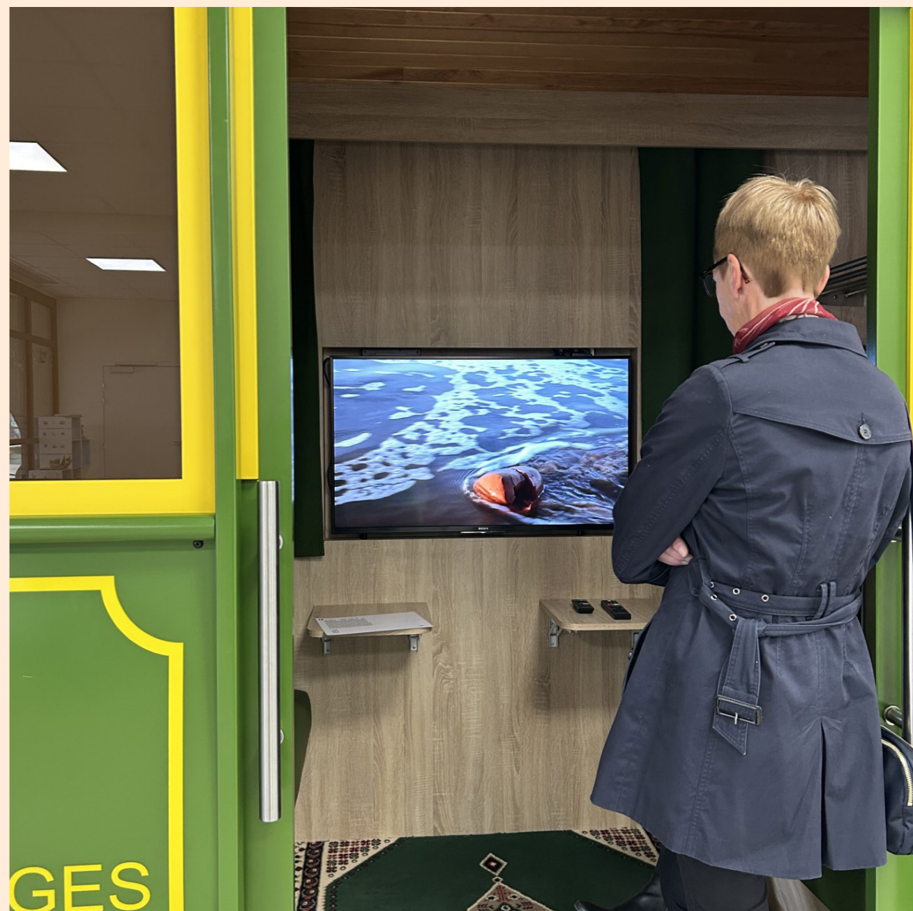
Vue de l'exposition dans la médiathèque du Village, 2025.