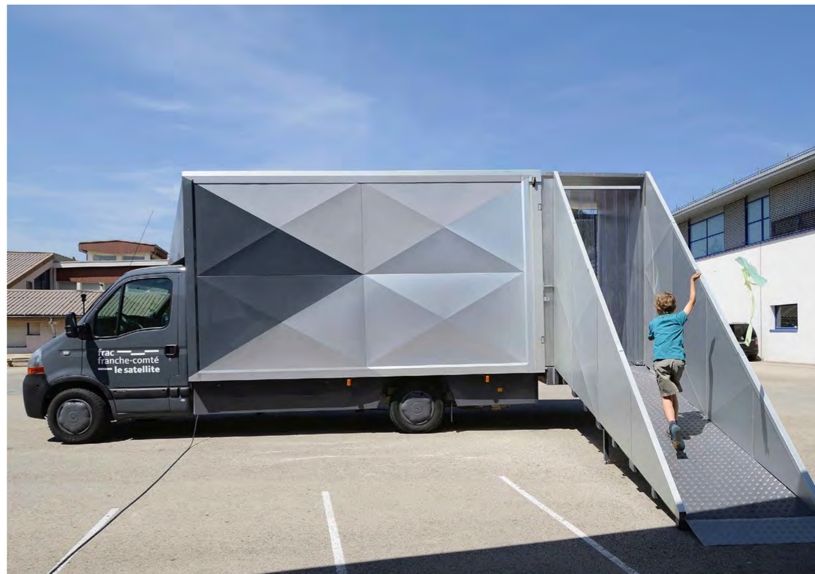
Le Satellite du Frac Franche-Comté.

Le Satellite propose une exposition thématique réalisée avec les œuvres de la collection du Frac. Ainsi, le public peut entrer dans un univers, explorer une problématique, découvrir les artistes et se familiariser avec leur démarche artistique. L'exposition dans le Satellite, renouvelée régulièrement, s'accompagne d'échanges menés avec un médiateur ou une médiatrice et d'outils invitant à la découverte.