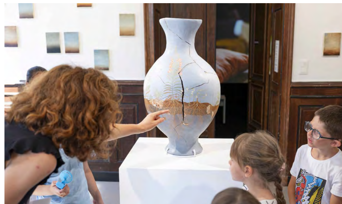
La Villa / Frac-Collection.

« Une belle ouverture pour l'esprit. » / V. « Ca m'a étonnée, fait réfléchir à ma condition d'être humain, fait sourire et plutôt amusée. » / S.B. « Parfaitement remuant. » / E.C. — Commentaires de visiteurs