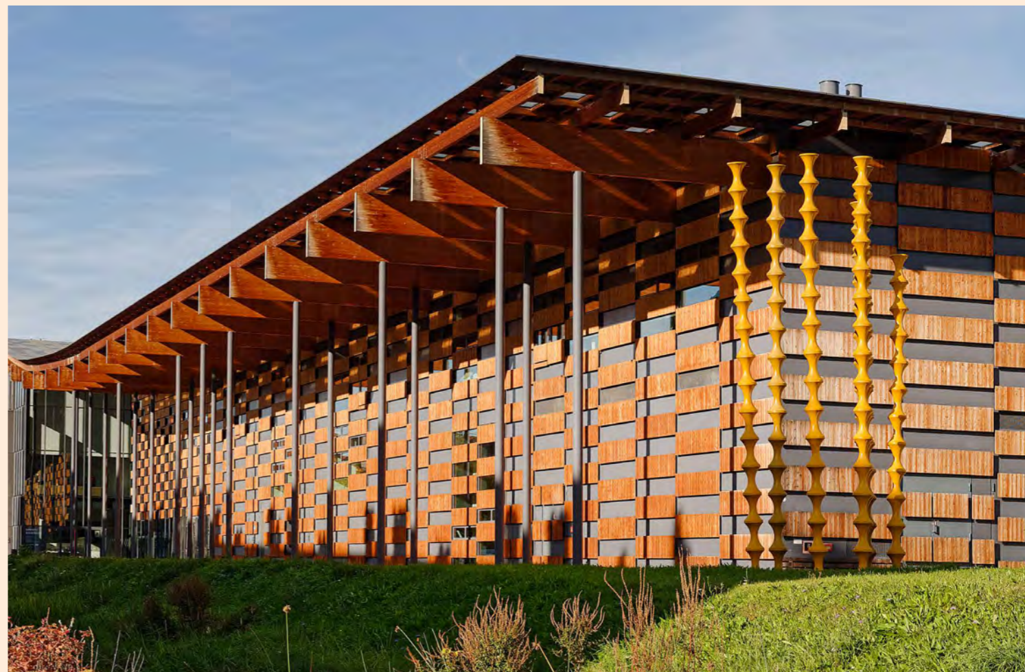
Frac Franche-Comté, Cité des Arts, Besançon © Kengo Kuma & Associates / Archidev.

En 2024, le Frac a travaillé avec : 11 partenaires socio-éducatifs, santé et handicap 22 partenaires éducation 32 partenaires culturels 12 partenaires institutionnels