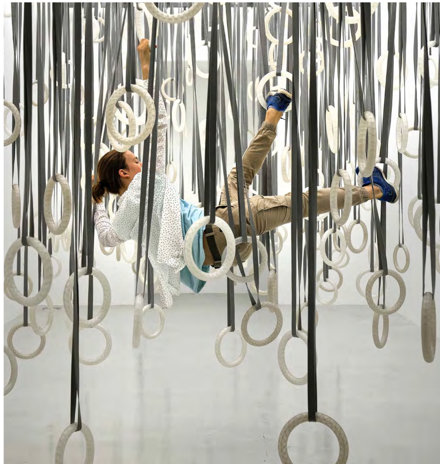
Vue de l'exposition Les Figures du Vide , Frac Franche-Comté, 2023. William Forsythe, The Fact of Matter , 2009. Collection Frac Franche-Comté © William Forsythe.