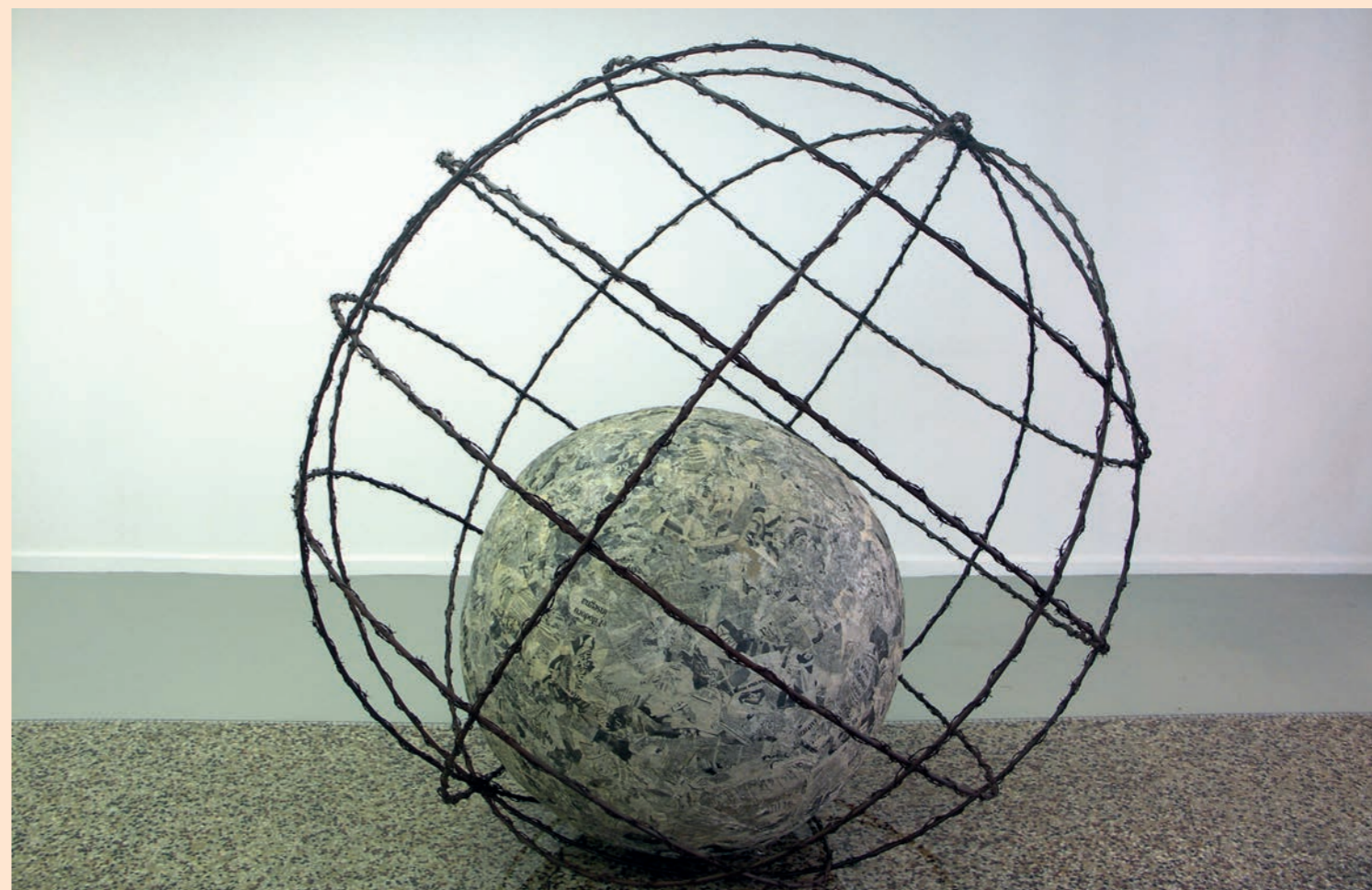
Michelangelo Pistoletto, Mappamondo Spinoso.