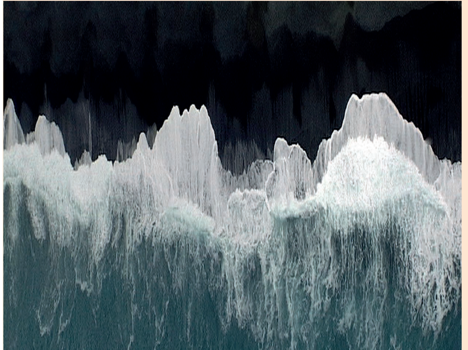
Ange Leccia, La mer.

Fréquence FRAC est une nouvelle collection d'œuvres sonores commandées à des artistes, sous forme de podcasts aux formats hybrides. Ces pièces donnent à entendre la vitalité de la création contemporaine en s'affranchissant des contraintes spatiales, tout en valorisant un médium encore trop peu visible dans les arts visuels. Le projet répond aussi aux réalités territoriales : le FRAC étant situé en montagne, à Corte, l'accès physique aux expositions reste limité. Fréquence FRAC permet ainsi d'inviter les habitants de l'île à se relier à l'institution en chemin, sur la route, dans leur quotidien, et prolonge l'expérience de l'art en dehors des murs.