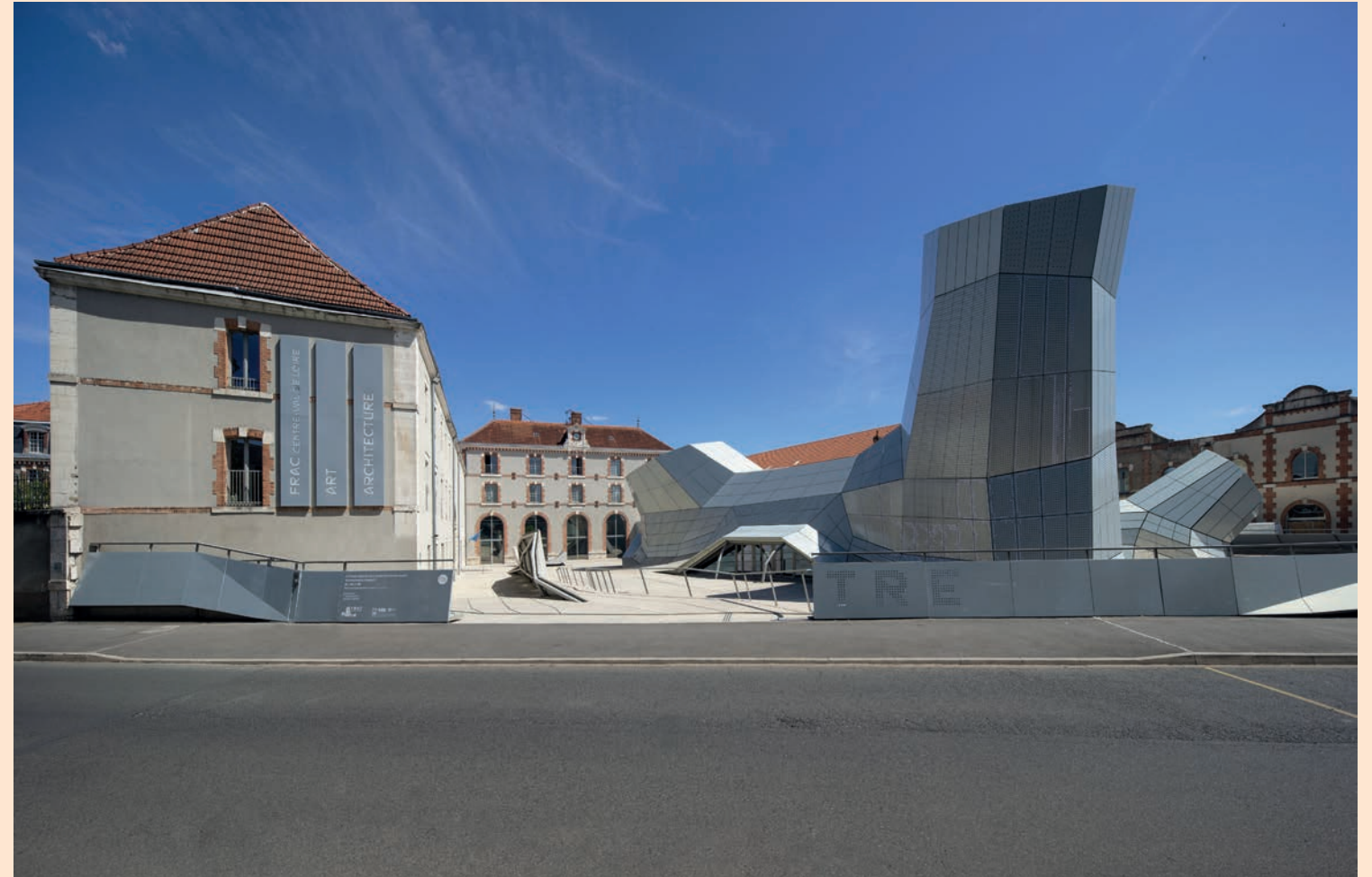
Les Turbulences – Frac Centre-Val de Loire, Orléans © Jakob + MacFarlane.