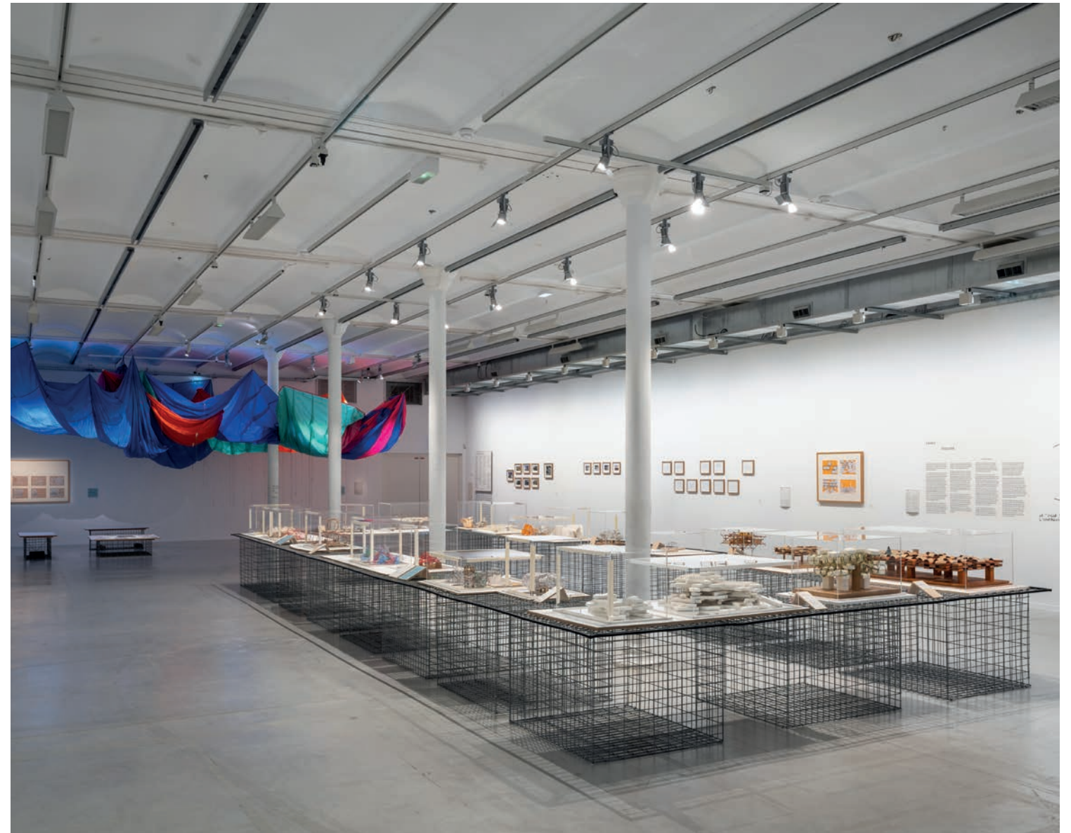
Vue de l'exposition Des villes pour vivre , Yona Friedman, 2025. Frac Centre-Val de Loire. Photo : Martin Argyroglo © Adagap, Paris, 2025.

Le jumelage " Quartier de culture " avec les Blossières, quartier de politique de la ville d'Orléans inscrit sur trois ans, illustre pleinement cette volonté : ateliers, résidences, expositions et activation d'œuvres de la collection balades urbaines et productions partagées permettent de relier architecture, mémoire, transformations urbaines et pratiques citoyennes. Ainsi, en articulant sa collection d'avant-garde à des expérimentations situées, en associant pratiques artistiques, enjeux de société, transition écologique et coopération territoriale, le Frac Centre-Val de Loire se positionne comme un laboratoire institutionnel et citoyen capable d'inventer avec les architectes, les artistes et les habitants de nouvelles façons d'habiter demain.