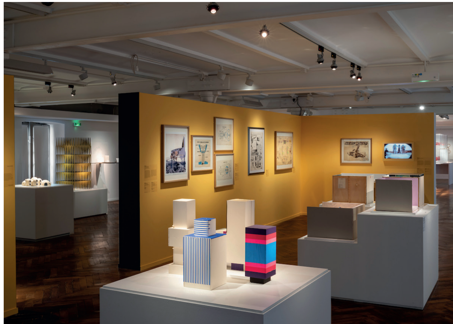
Vue de l'exposition Horizons en mouvement , 2024 - Frac Centre-Val de Loire

En 2025, le Centre Pompidou, la Cité de l'architecture et du patrimoine, et le FRAC Centre-Val de Loire se sont associés pour créer une Alliance ayant pour objectif de valoriser les collections nationales d'architecture. Plus largement l'alliance vise à mutualiser expertises et ressources, développer des projets scientifiques et culturels communs, coordonner certaines orientations d'acquisition et renforcer la diffusion des collections et des archives auprès du public et des chercheurs à l'échelle nationale et internationale.